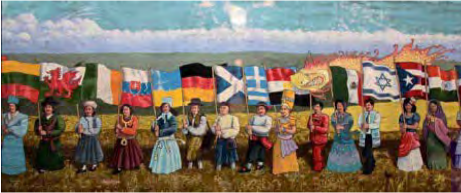
Llun gwreiddiol: R. Miller/flickr Diversity

Y mae'r Ysgrhythur yn dweud, "Pob un sy'n credu ynddo, ni chywilyddir mohono." Nid oes dim gwahaniaeth rhwng Iddewon a Groegiaid. Yr un Arglwydd sydd i bawb, sy'n rhoi o'i gyfoeth i bawb sy'n galw arno. Oherwydd, yng ngeiriau'r Ysgrhythur, "bydd pob un sy'n galw ar enw yr Arglwydd yn cael ei achub, pwy bynnag yw".