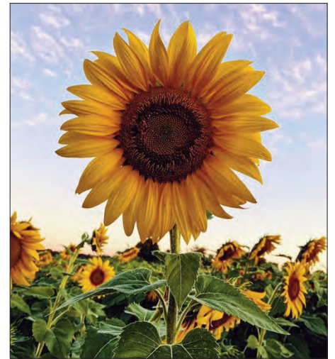
Blodyn yr Haul yw blodyn cenedlaethol Wcráin

Mae'r gefnogaeth yn ymarferol hefyd, wrth i wledydd agor eu ffiniau i groesawu ffoaduriaid. Mae llywodraeth y Deyrnas Gyfunol yn arfer geiriau da